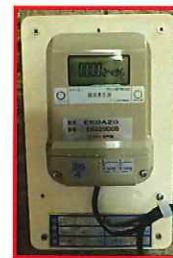
電子式メータ標準施工図